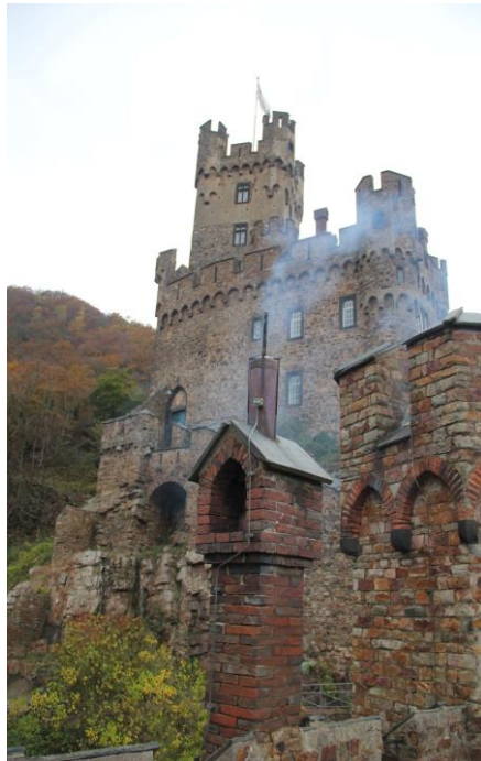
Fotografía: castillo de Sooneck